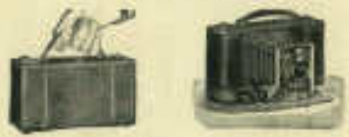
Die System 10 o Carlsson mit 10 o Carlsson 10/12 cm.

Preis des Systems ..... 120,00 Mk. Linsen ..... 1,00 Mk. Diese Handkammer, bei Reparatur mit einer Spule für 12 Sekunden zu laden.