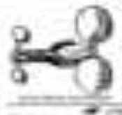
Illustration of a pair of scissors This illustration shows a pair of scissors with two blades and a central pivot point. The blades are slightly curved and have small notches near the tip. The handles are simple and rounded.