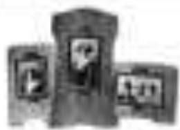
Photo 1 [Illegible text] Photo 2 [Illegible text] Photo 3 [Illegible text]