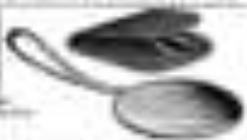
Illustration of a pair of shoes This illustration shows a pair of simple, rounded shoes. One shoe is shown from a side profile, and the other is shown from a top-down perspective.

Illustration of a screwdriver and a bolt This illustration shows a screwdriver with a flat head and a bolt with a hexagonal head. The screwdriver handle is simple and the bolt has a standard thread.