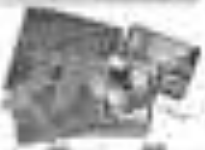
Illustration of a hand holding a pencil This illustration shows a hand holding a pencil in a tripod grip, similar to the previous ones, but from a different perspective.

Illustration of a hand holding a pencil This illustration shows a hand holding a pencil in a tripod grip, similar to the previous one, but from a slightly different angle.