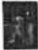
Illustration of a hand holding a pencil This illustration shows a hand holding a pencil in a tripod grip, similar to the previous ones, but from a different perspective.